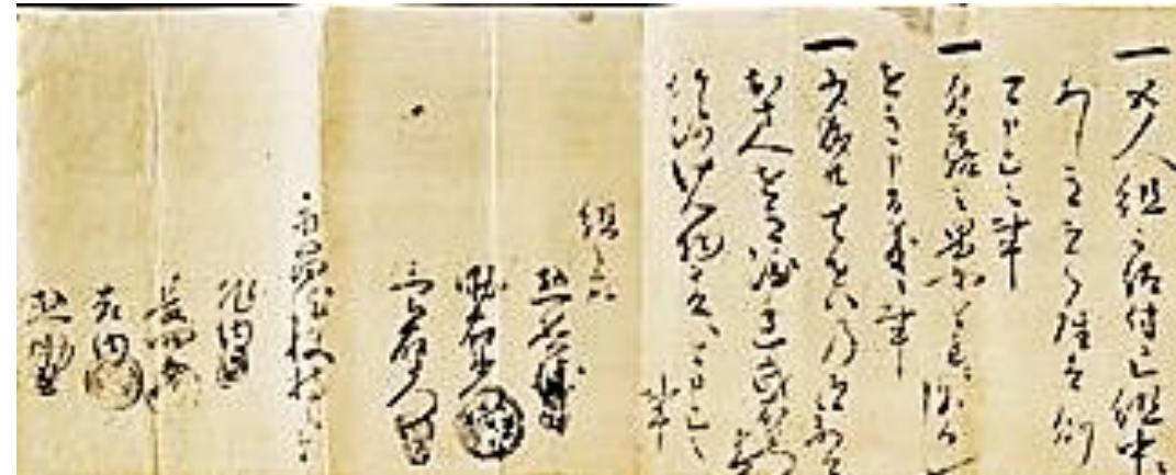
山梨県永昌院五人組帳をネットより。ひとりひとり印があるんですね