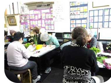
(1月の講習会の様子)