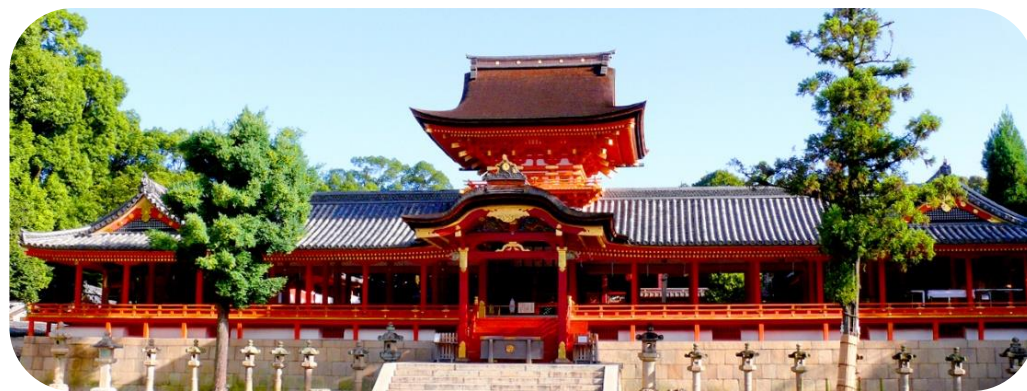
石清水八幡宮