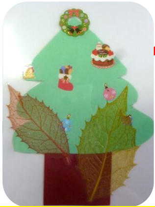
前回のクリスマスカード