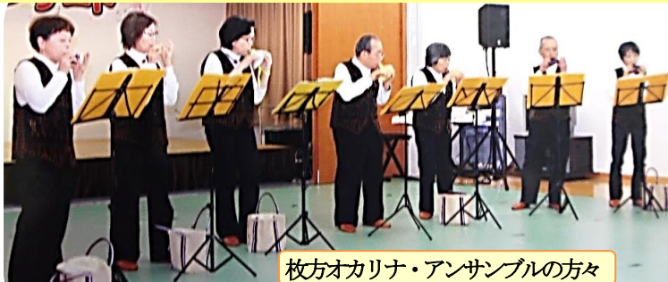
枚方オカリナ・アンサンブルの方々