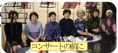
コンサートの前に

ことでチェルノブイリ被災の方々に思いを馳せる。まるごと館の朝、皆でコンサートのためのイチゴ大福を作る、オカリナ演奏のひと時、皆大切に