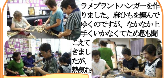
マクラメランプハンガー

来られて、12月のクリスマスコンサートで演奏する曲を通して練習しました。中々全員で揃うことが少なく、残念ですが、無理なくアバウトな感じで楽しめるならばもっともっと参加したいという方も気軽に来られるように思っています。そんな中でゆっくとステップアップしていると思うのですが、如何でしょうか。毎週月曜日の2年と数ヶ月の自主練習をよく積み重ねてきたものです。毎回同じ曲をずっと吹いています。楽しいです。