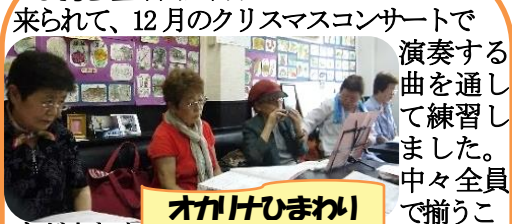
オカリナひまわり

来られて、12月のクリスマスコンサートで演奏する曲を通して練習しました。中々全員で揃うことが少なく、残念ですが、無理なくアバウトな感じで楽しめるならばもっともっと参加したいという方も気軽に来られるように思っています。そんな中でゆっくとステップアップしていると思うのですが、如何でしょうか。毎週月曜日の2年と数ヶ月の自主練習をよく積み重ねてきたものです。毎回同じ曲をずっと吹いています。楽しいです。