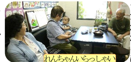
れんちゃんらっしやい

まるごと館はひとが集まる、交流する場として、今まで色々な取り組みを行なってきました。