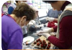
皆でイチゴ大福を作る

筆者の中の知りたいというのは未熟だけれど、つながって行きたいという気持ちの表れなのかなと思います。そういう