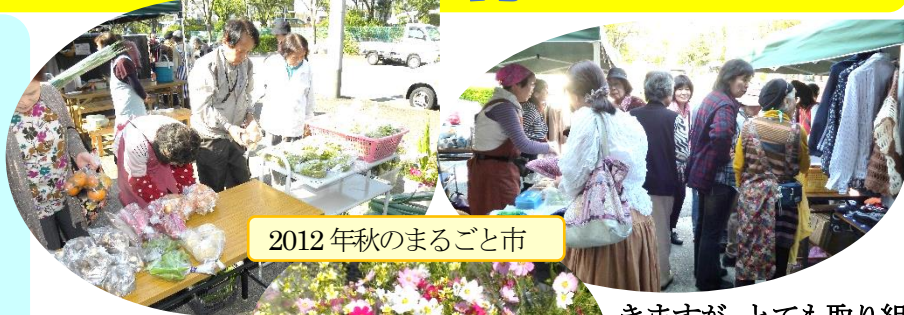
2012年秋のまるごと市