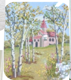
館内の展示物・刺繍