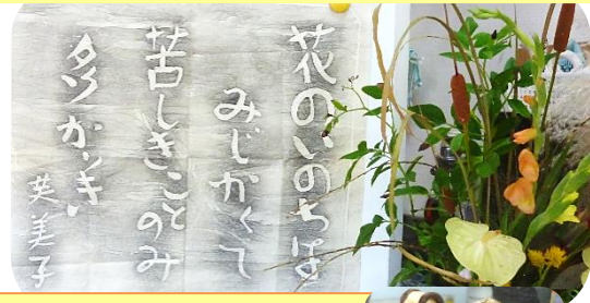
館内の展示物・拓本、竹細工