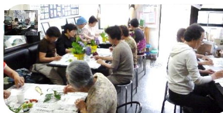
6月11日絵手紙講習会