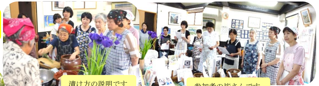
漬け方の説明です

おふたりは話をされながら、説明して下さいました。昨年は15人分用意しましたが、その中で昨年の暑さで「ぬか床が駄目になった」という方が半分近くおられました。