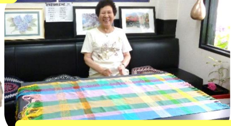
大きなテーブルクロスが出来ました！