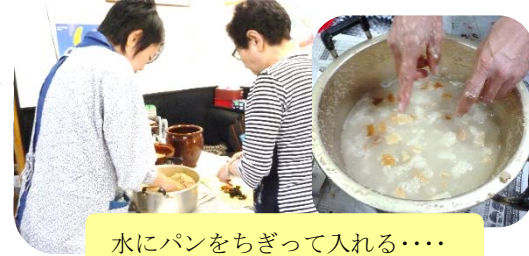
水にパンをちぎって入れる・・・

来るのは手間がかかるけれど、とても貴重なことではないか。多くの方との関わり合いやその方々の様々なヒントから、(ぬか床や