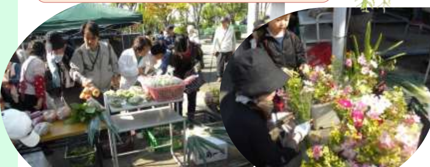
(2012年10月21日秋のまるごと市より 野菜・花)