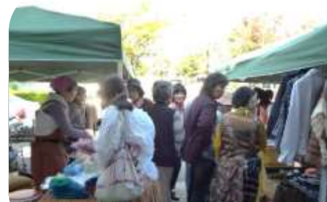
(2012年10月21日まるごと市 フリーマーケット)