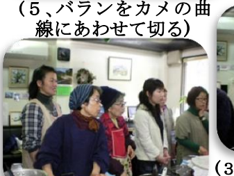
(5、 balan をカメの曲線にあわせて切る)