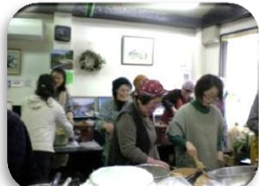
(3、時間をかけて麴と塩と大豆を混ぜる麴が十分ふくらむまで待つ)

家から煮大豆を鍋ごと持ってきて、実際に作った方は7名でした。参加されたきつかけは、美味