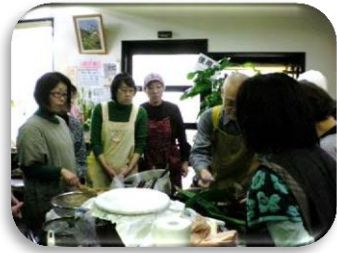
(2、ビール瓶で煮大豆をつぶす)