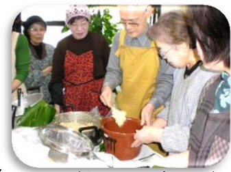
(4、カメの側面につかないように真中を高くして優しくつめる)