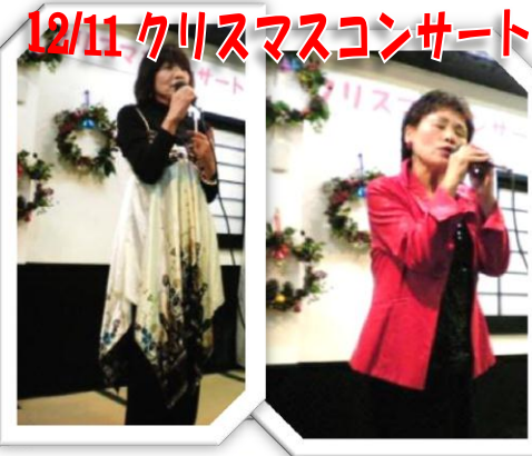
12/11 クリスマスコンサート